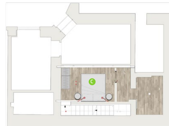
SOPPALCO / MEZZANINE