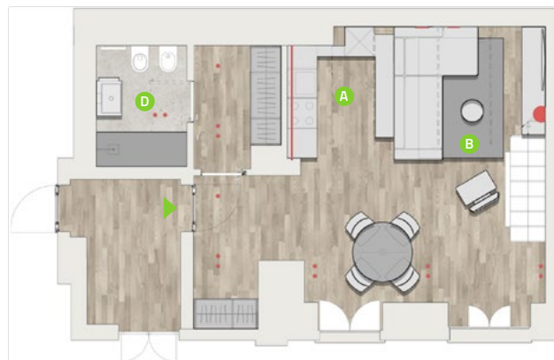
PIANO INFERIORE / GROUND FLOOR