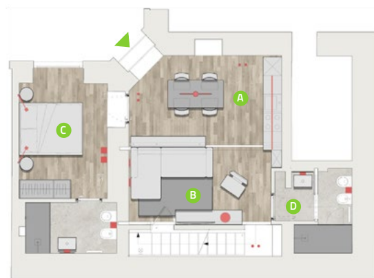
PIANO INFERIORE / GROUND FLOOR