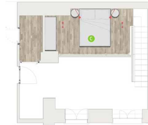
SOPPALCO / MEZZANINE