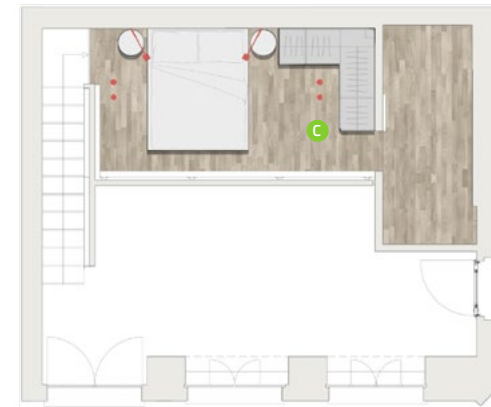
SOPPALCO / MEZZANINE