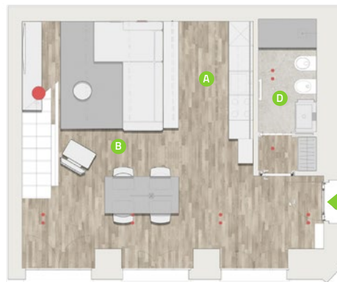
PIANO INFERIORE / GROUND FLOOR