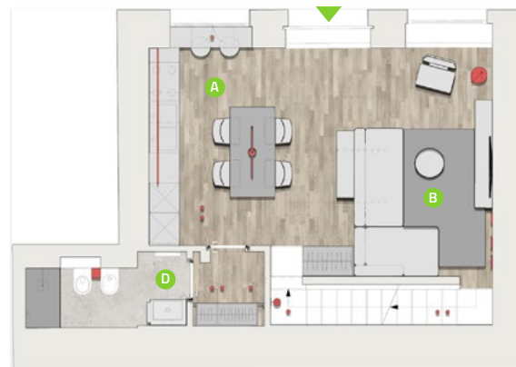
PIANO INFERIORE / GROUND FLOOR