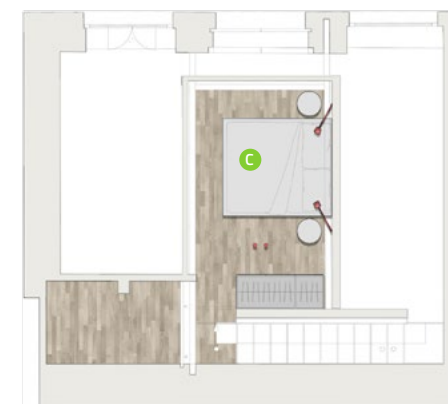
SOPPALCO / MEZZANINE